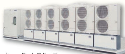
ウォーターレスクーラー ウォーターレスハイブリッド